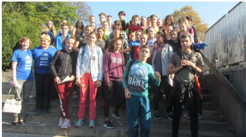
Slika 25: Dijaki na Ljubljanskem maratonu