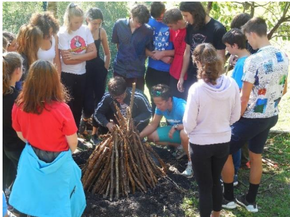
Slika 1: Dijaki 2. B in 2. C na jesenski šoli v naravi