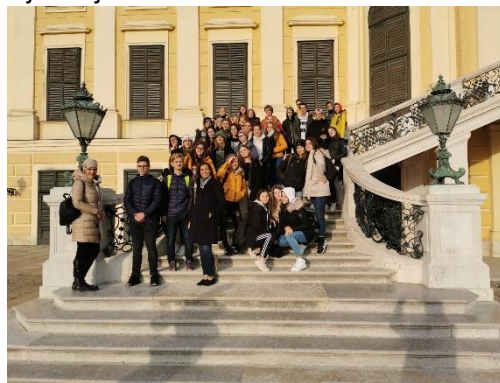
Slika 12: Predbožični Dunaj