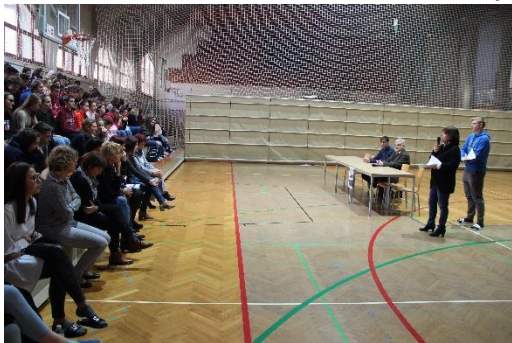
Slika 15: Nefiksov karierni dan