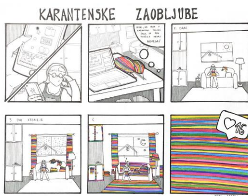
Slika 19: Zoja Šporn, 1. B Karantenske zaobljube