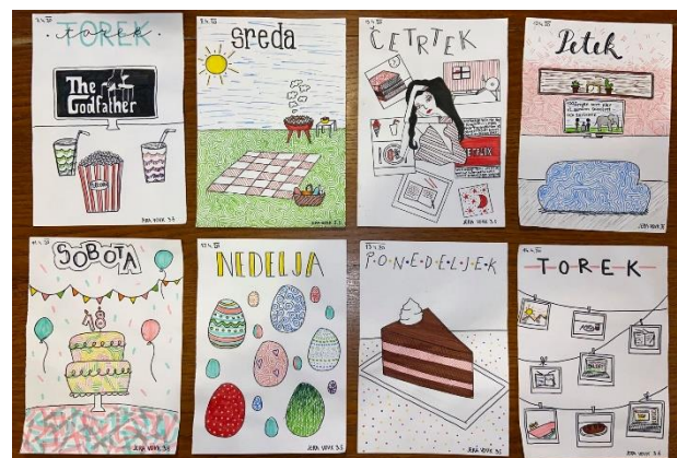
Slika 20: Jera Vovk, 3. Š Umetniški dnevnik