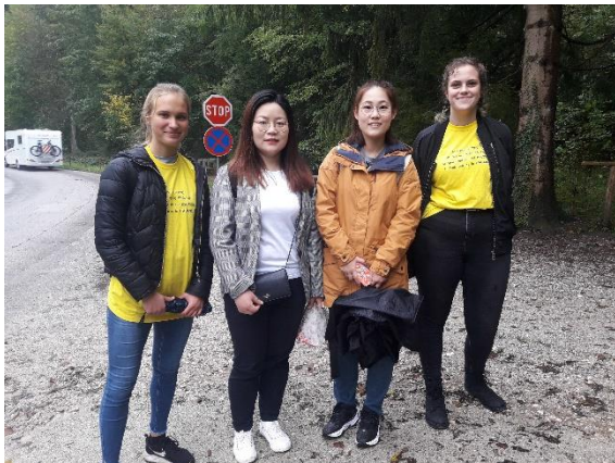
Slika 5: Pogovori se z menoj