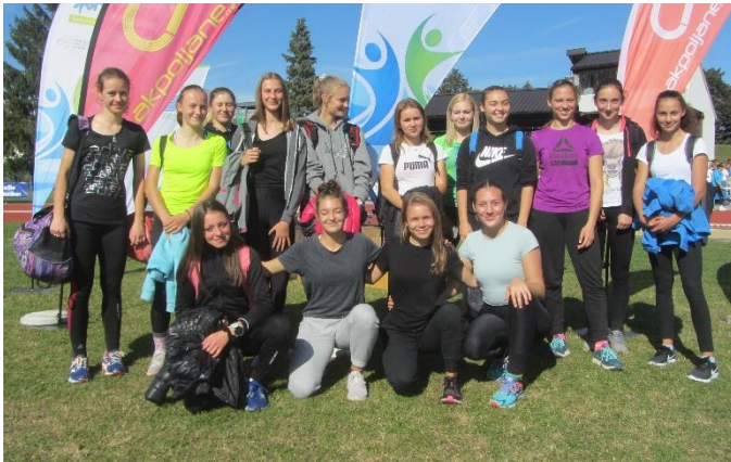
Slika 7: Državno prvenstvo v atletiki