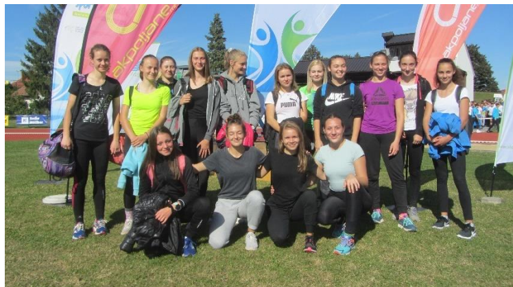
Slika 24: Dijakinje na državnem ekipnem prvenstvu v atletiki