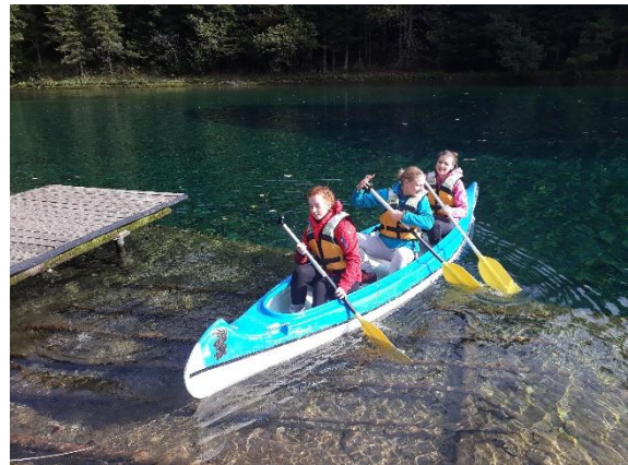
Slika 6: Vikend tabor v okviru predmeta ITS naravoslovje