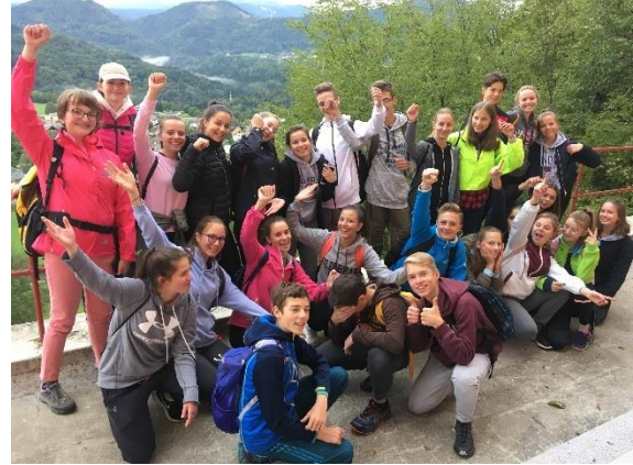
Slika 4: Športni dan dijakov 1. B