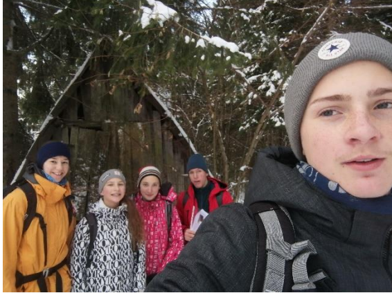
Slika 13: Kondicijsko-orientacijski trening MEPI