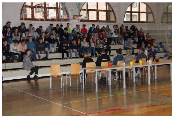
Slika 10: Inženirji bomo