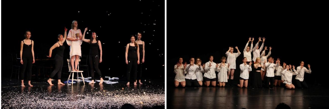
Slika 17: Dramski festival