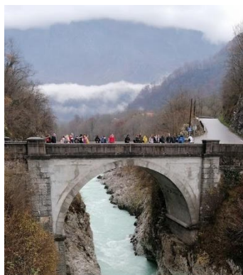
Slika 9: Geografska ekskurzija v Posočje