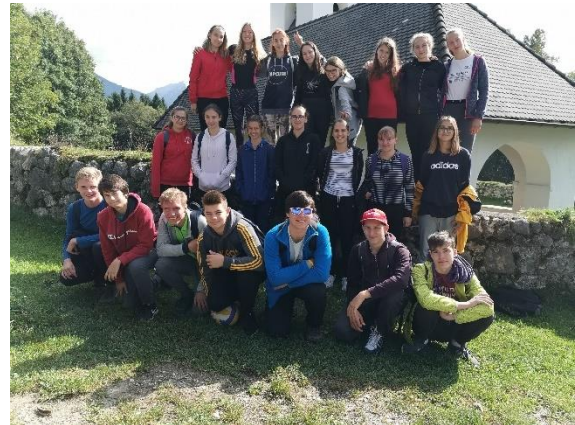
Slika 2: Športni dan dijakov 1. A