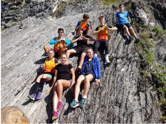
Slika 3: Nastop dijakov na državnem prvenstvu v gorskem teku