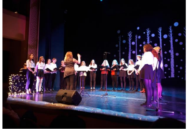
Slika 14: Božično-novoletni koncert