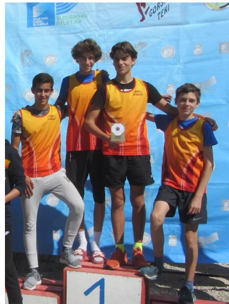
Slika 23: Državno prvenstvo v gorskem teku