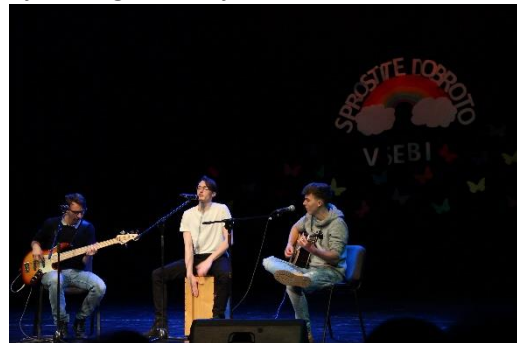
Slika 16: Dobrodelni koncert Sprostite dobroto v sebi