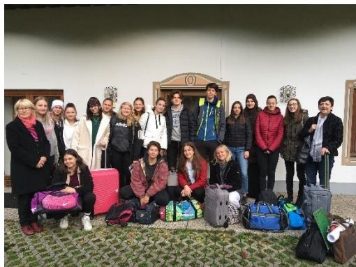
Slika 11: Nemški jezikovni tabor DSD